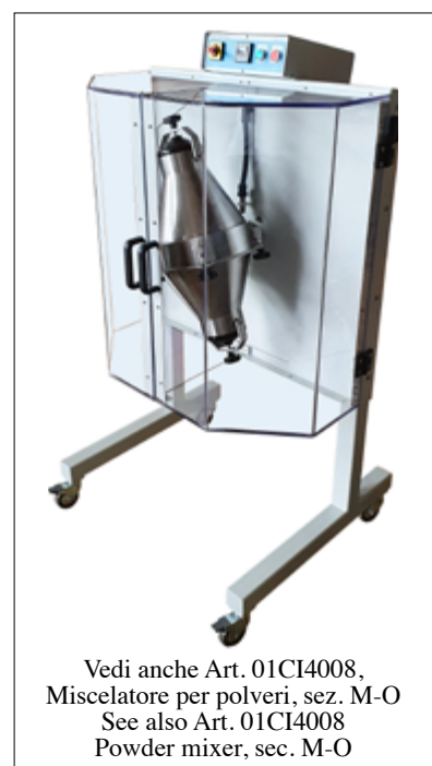
Vedi anche Art. 01CI4008, Miscelatore per polveri, sez. M-O See also Art. 01CI4008 Powder mixer, sec. M-O