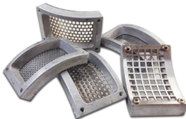
Setacci varie misure Sieves various measures