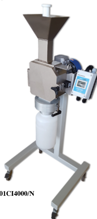
Art. 01CI3980 + 01CI4000/N