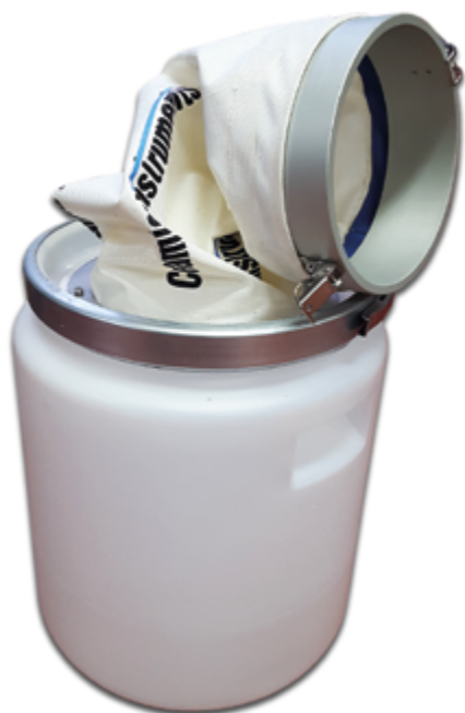
Art. 01CI4000G + 01CI4000/L